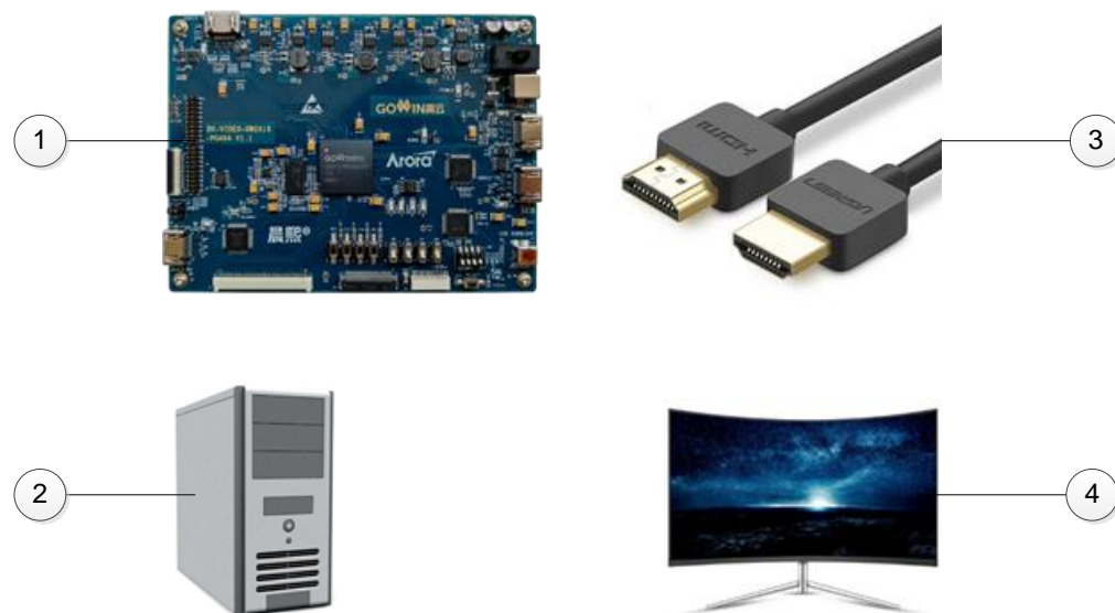
图 1 系统组成

基于 DK-VIDEO-GW2A18-PG484 开发板的 HDMI 视频放大 DEMO 系统组成如图 1 所示。